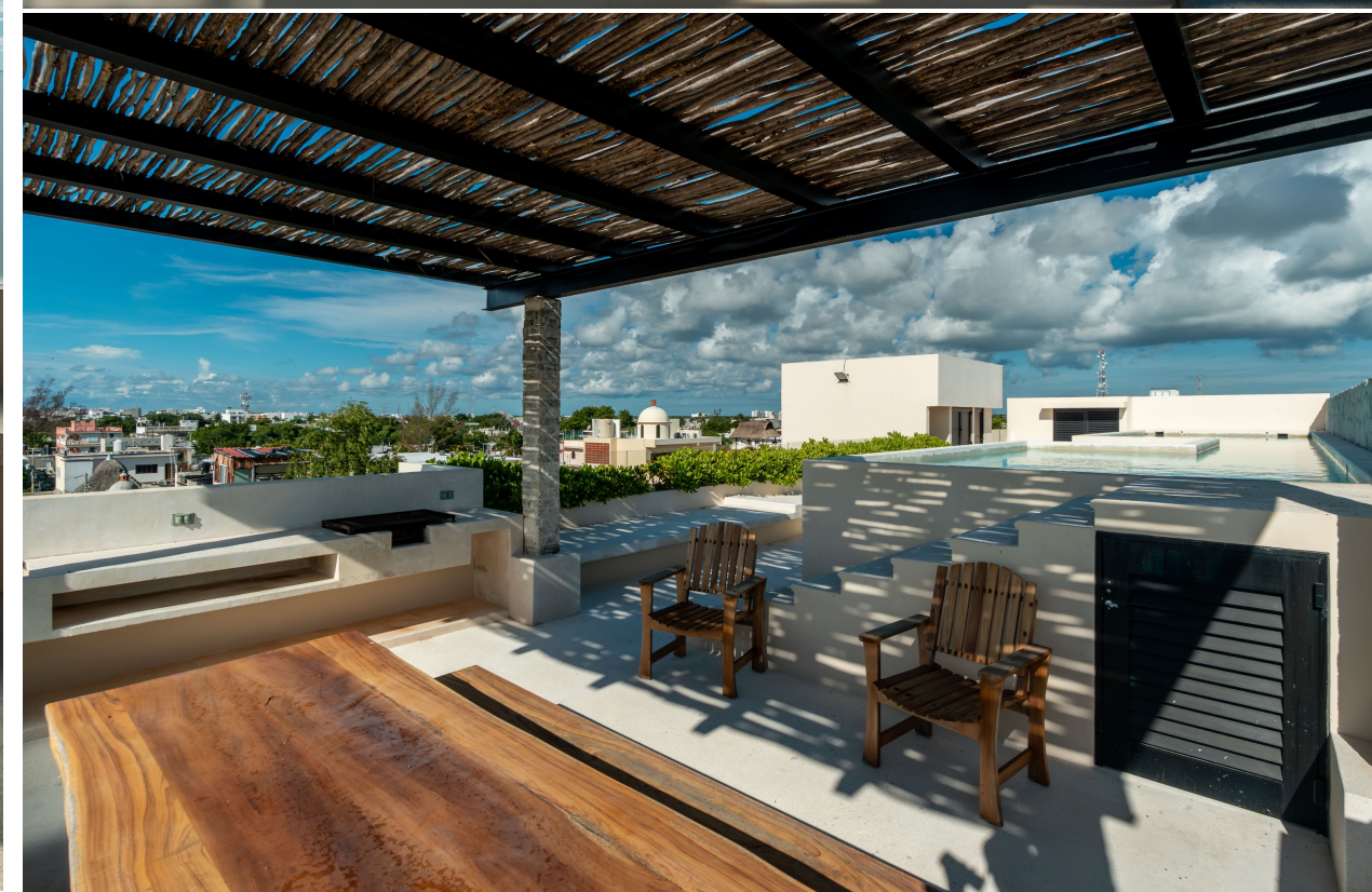
Alberca con vista panorámica, pérgola para estar y tumbones para asolear.